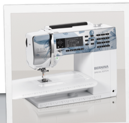
B 530 Dressmaker mit Anschlagetisch